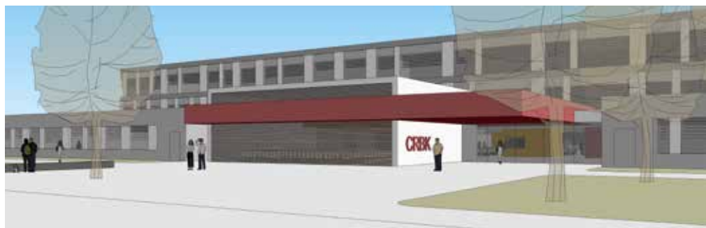
Gebäudeansicht im Eingangsbereich nach dem Planungsentwurf des Architekturbüros pbs

Schulgemeinschaft stellen, u.a. durch teilweisen Umzug an Ersatzstandorte. Jedoch freuen wir uns auf die Aufwertung des Gebäudes, das sich nach der Sanierung sicherheitstechnisch, energetisch und architektonisch auf einem hochmodernen Stand befinden und nach zeitgemäßen pädagogischen Ansätzen konzipiert sein wird. Die Unterstützung durch unseren Schulträger lässt uns dem Investitionsprojekt mit Neugierde und Zuversicht entgegen sehen.