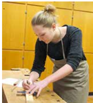
Schülerin bei der praktischen Arbeit in der Holzwerkstatt