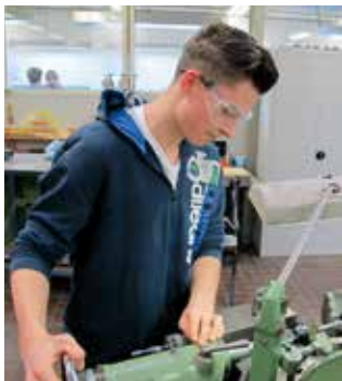
Schüler der Ausbildungsvorbereitung in der Metallwerkstatt

der Berufsfachschule 1. Hier bieten wir die Berufsfelder Bau- und Holztechnik, Elektrotechnik, Farbtechnik und Metalltechnik an. Jugendlichen, die den Erwerb der Fachoberschulreife anstreben, steht mit Hauptschulabschluss nach Klasse 10 der Besuch der Berufsfachschule 2 offen. Hier besteht die Wahl zwischen den Berufsfeldern Bau- und Holztechnik, Elektrotechnik und Metalltechnik sowie Ernährungs- und Versorgungsmangement oder Farbtechnik.