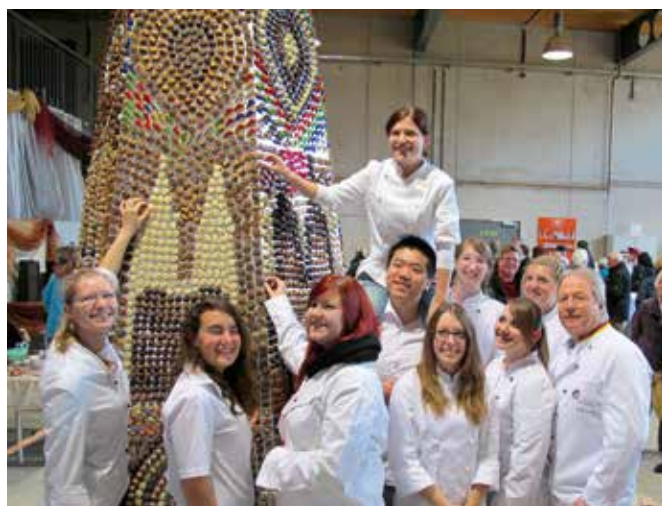
Präsentation der Pralinenpyramide am 22. November 2014

Auch in schulbereichsübergreifenden Projekten erweisen sich die unterschiedlichen fachlichen Kompetenzen, gebündelt an einem Schulstandort, erfahrungsgemäß als gewinnbringend. Als prominentes Beispiel wurde im Schuljahr 2014/2015 das Pralinenprojekt realisiert, das unser Konditormeister im Dezember 2014 zum Abschluss brachte. Gemeinsam mit angehenden Konditorinnen und Konditoren hatte er sich das ehrgeizige Ziel gesteckt, eine sechs Meter hohe Pyramide mit selbstgefertigten Pralinen zu gestalten, diese im November 2014 im Pädagogischen Bauzentrum