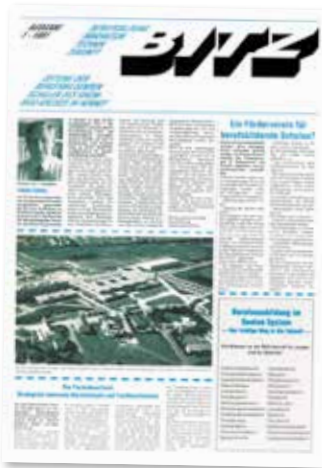
Titelseite der BITZ 1991

lerinnen und Schülern über die Möglichkeiten der schulischen und beruflichen Laufbahn haben heute einen besonders hohen Stellenwert. Dazu werden von uns neue und andere Medien genutzt als zur Entstehungszeit unserer Zeitung: die Internetpräsenz der Schule mit nahezu tagesaktuellen Berichten und Fotos, die Bildungsbroschüre mit einer umfassenden Darstellung des Bildungsangebotes, die Veröffentlichung von Informationsblättern zu den vielfältigen, zum Teil völlig neuen Bildungsgängen, die Online-Schüleranmeldung, die Präsenz der Schule bei Ausbil-